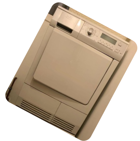
Electrolux szárítógép 2009 (Lajos)