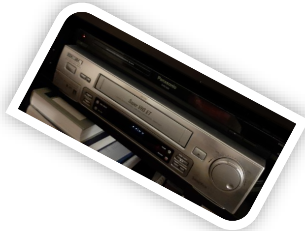
Thomson VHS magnó (Dolli)