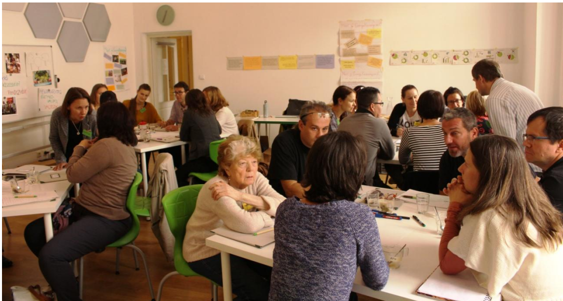
Önkéntes klíma-koordinátorok képzése, felkészítése

A program nemcsak egyéni előnyökkel jár az energiaszámlákkal kapcsolatos megtakarítások és a zöldebb életmódból származó egyéb előnyök révén. Az ország végső energiafogyasztásának egyharmadáért felelős magyar háztartások jelentős szerepet kaphatnak az ország karbon-lábnymának csökkentésében és az éghajlatpolitikai célok elérésében is.