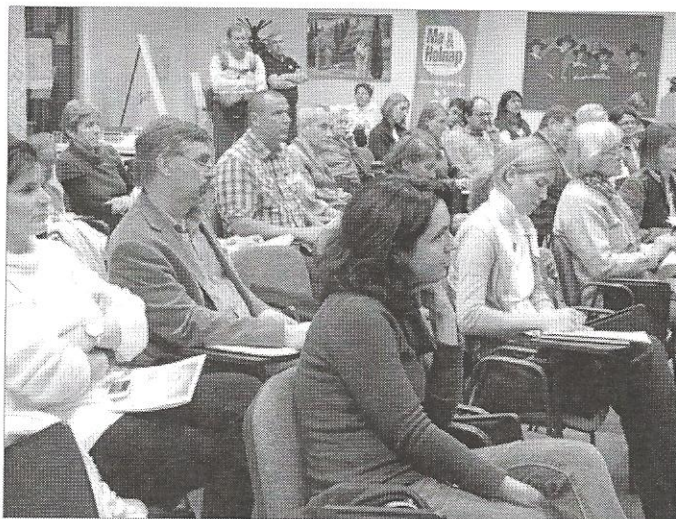
Hallgatóság a gödöllői nyitórendezvényen