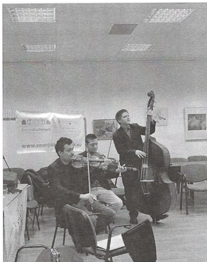
Zenél a Bivaly együttes: táncsal indítottuk a megtakarítást...

November 25-i nyitórendezvényünk után a lelkesedés nem hagyott alább! Közel 120 háztartásban kezdték el a mérőóra leolvasásokat, függesztették ki a fogyasztásmérő lapokat és a versenyben való részvételt hirdető posztereket. Klíma-koordinátoraink folyamatosan dolgoznak azon, hogy mindenkinek sikerüljön regisztrálni a honlapon ( www.energyneighbourhoods.eu/hu/home ), felferüljenek az első leolvasások és összehasonlításképp a referencia adatok értékei.