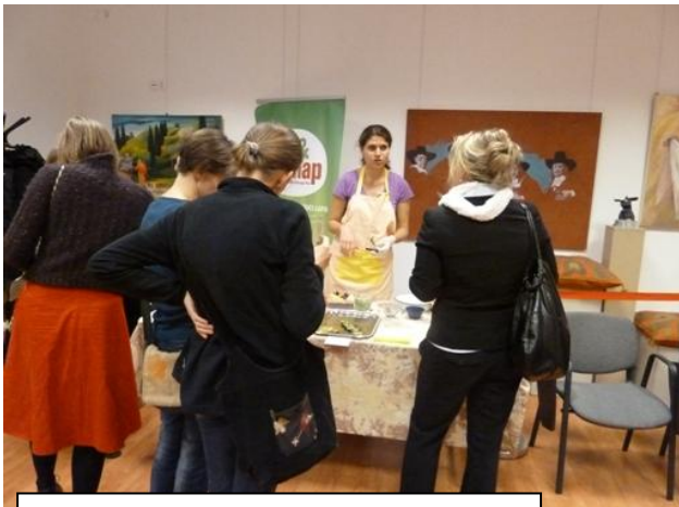
Érdeklődés a klímabarát ételeknél