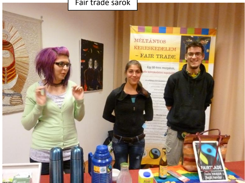
Fair trade sarok