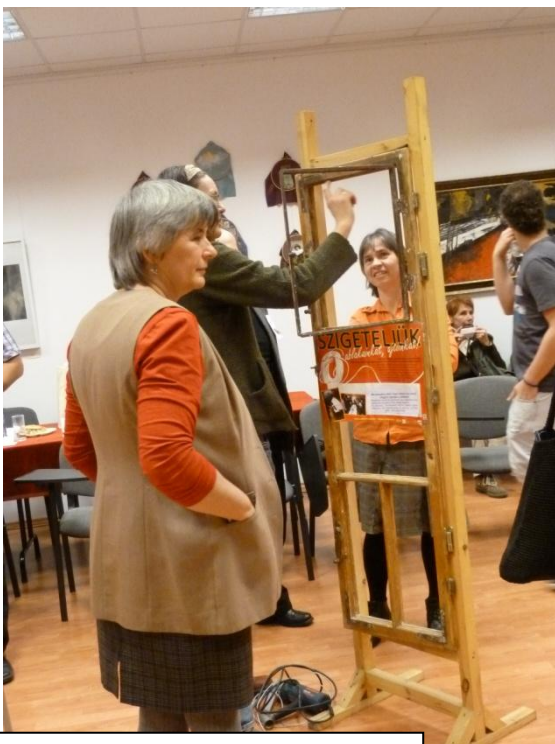
Szigeteljünk klímabarát módon