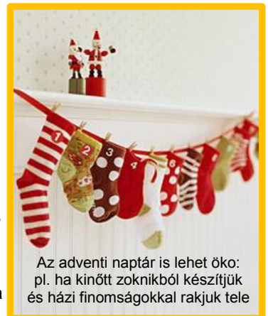
Az adventi naptár is lehet öko: pl. ha kinőtt zokniból készítjük és házi finomságokkal rakjuk tele

THIS YEAR MY GIFT TO YOU IS OUR CALL FOR SOCIAL ECONOMIC JUSTICE IN RETURN ***** I'M REQUESTING LOVE & MEMORIES RATHER THAN STORE-BOUGHT GIFTS EMBRACE COMMUNITY NOT CONSUMPTION